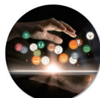
魅力的な支援メニュー