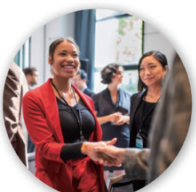
交流会・イベント